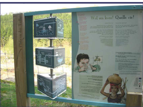
(sentiers) comportant une dimension pédagogique (sensibilisation des visiteurs et de la population locale).

L'objectif du projet sera donc de valoriser le patrimoine naturel du territoire en créant des produits touristiques